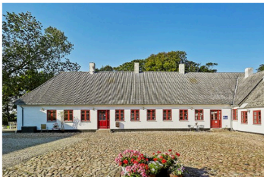
#9 Bed and Breakfast Åløkke